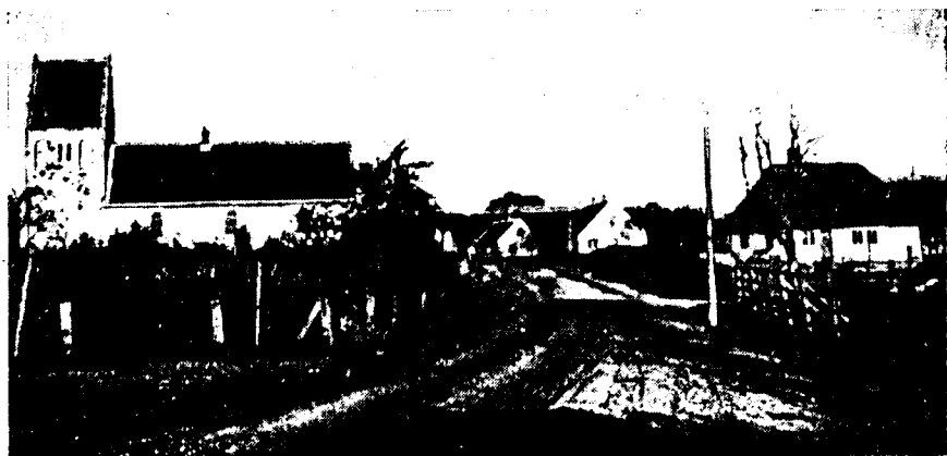
Dette billede fra før 1906 fra Gl. Ejby er udlånt af Hans Chr. Pedersen, Grimmerløkkevejen, og viser bl. a. at der har ligget to huse, hvor nu præstegård og præstegårdshave ligger.

1830 hedder det i »Jensens Provincialleksikon«, at det har 165 tdr. hartkorn, 300 indbyggere, 21 gårde og 26 huse.