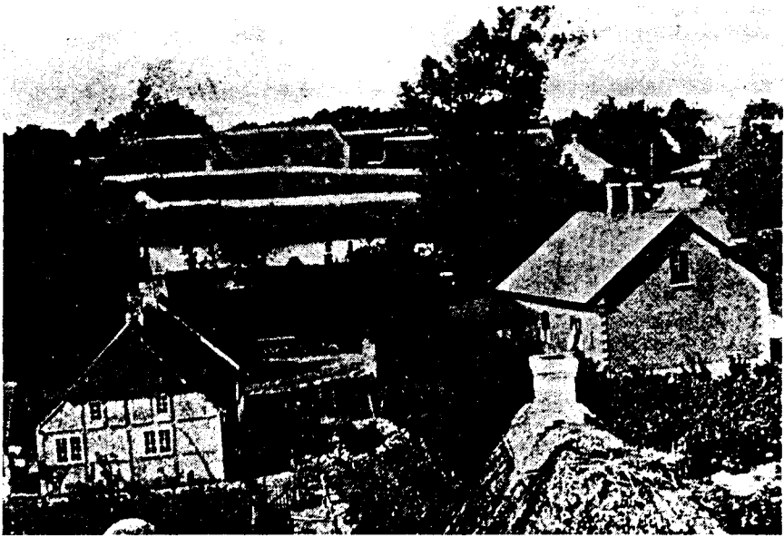
Gl. Ejby set fra kirketårnet mod nord o. 1903